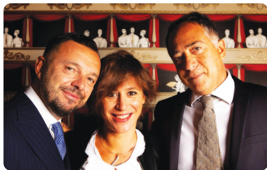
Gebbia Bortolotto Penalisti Associati Torino - Milano - Roma - www.gbpenalisti.it LinkedIn: Gebbia Bortolotto Penalisti Associati

Con oltre dieci anni di storia e tre sedi sul territorio nazionale (a Torino, Milano e Roma), lo studio rappresenta oggi una realtà di riferimento per imprese e grandi gruppi industriali, anche di profilo internazionale, operanti in tutti i principali settori dell'industria.